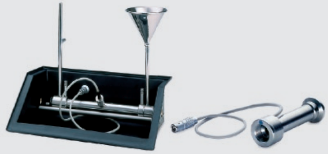
Durchflussröhre mit integriertem Temperatursensor und automatischer Erkennung der Röhrenlänge

Der Einsatz einer Durchflussröhre mit integriertem Temperatursensor sichert eine temperaturkompensierte Messung der Polarisation. Die Brix-Messung wird unabhängig davon ebenfalls temperaturkorrigiert.